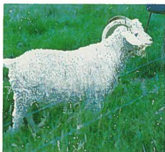
Fotos aus Löhler/Leuchter, Ziegen und Schafe* sowie H. Kühnemann, Ziegen*, Verlag Eugen Ulmer, sowie agrarpress, Dierichs